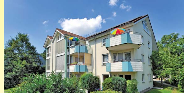
Der gesamte Bestand umfasst ca. 1.000 Wohnungen